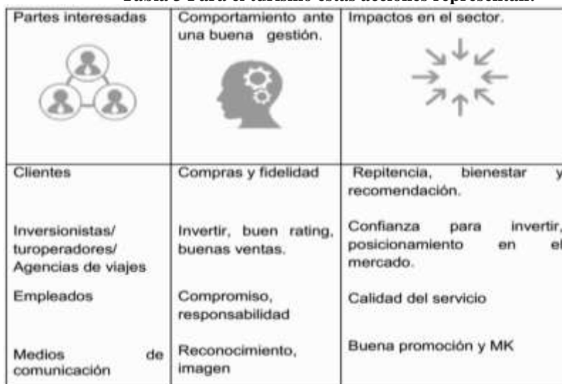
Tabla 3 Para el turismo estas acciones representan:

Desde el punto de vista económico social estas acciones se justifican ante la necesidad del país de continuar desarrollando el turismo. Las condiciones naturales de Cuba, la infraestructura hotelera y ofertas extra hoteleras sumamente atractivas, más los resultados de la labor desplegada en el enfrentamiento y el control de la enfermedad de la Covid-19 constituyen elementos que pueden favorecer la captación de los primeros flujos de viajeros y en la identificación de la isla como destino seguro (tabla 3).